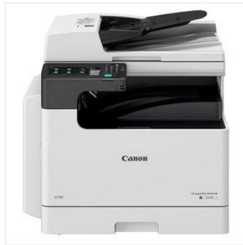
Изображения служат только для ознакомления, см. техническую документацию